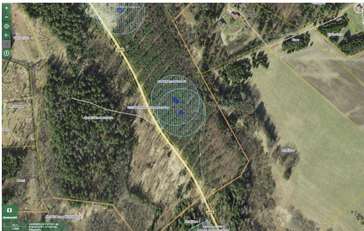
Lisa 2. Kääbaste reg-nr 12772–12773 asukohad Maa-ameti kultuurimälestiste kaardikihil seisuga 05.02.2024. (Alus: Maa-ameti kultuurimälestiste kaardikiht)